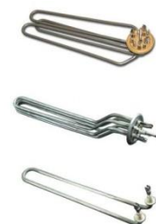
HEATERS FOR DISHWASHERS

Dessa rörformade värmelement är speciellt konstruerade för att användas i maskiner för att tvätta rätter, glasögon etc. i hotell,, restauranger är sjukhus etc. Värmare tillverkade av rostfritt stål hållbar för förekomst av rengöringsmedel och andra aggressiva lösningsmedel.