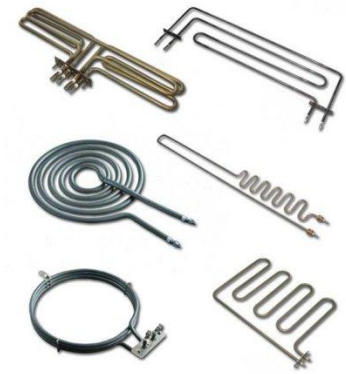
HEATERS FOR BREAD AND PIZZA OVENS

Eftersom dessa värmare är i konstant användning i bröd och pizza ugnar de har minskat ytlast och alltid är mörkt glödgas. Värmare är gjorda av rostfria rör och har god mekanisk hållfasthet vid höga temperaturer och långvarig livslängd. De kan böjas till olika former för att möta kundernas krav.