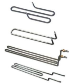
HEATERS FOR GRILL

Värmare för grillar och pannor är tillverkade av rostfria stålrör med mycket oxiderad yta för att förbättra bättre värmeöverföring genom strålning och mekanisk hållfasthet vid hög temperatur. De används för vanliga strålände grillar eller kan klämmas mot järn kastruller.