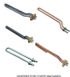
HEATERS FOR COFFE MACHINES

Värmare för kaffemaskiner är huvudsakligen gjorda av kopparrör med mässing rördelar och flänsar eftersom tanken på dessa maskiner är gjord av koppar. På begäran tillverkar vi rostfria värmare med rostfria flänsar. Vi tillverkar värmare för små hushåll kaffemaskiner och vattenkokare te och kannor