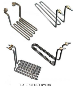
HEATERS FOR FRYERS

Aggregat för fritöser är gjorda av rostfria rör och direkt nedsänkt i fritureolja. Volym och form fritösen bestämmer formen, antal och makt värmeelement. Värmare är design för "professionell" användning för restauranger, barer och hotell samt för inhemska fritöser och har långvarig livslängd.