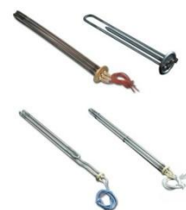
HEATERS FOR BOILERS, TANKS AND BAIN-MARIES

Mått, material och syfte av tankar och pannor bestämmer form, kraft och antal värmare samt material som värmare görs. Dessa värmare är tillverkade av koppar och rostfritt stålrör med olika monteringsflänsar.