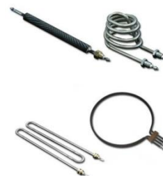
HEATERS FOR DRYERS

Värmarna används för torkning i maskiner med olika kapacitet. De är alltid av rostfria stålrör. Vi producerar flänsar rörelement för torkar med rostfria flänsar som ökar värme yta och minskar värmarens temperatur så förlänger värmare livstid.