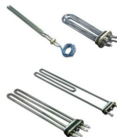
HEATERS FOR WASHING MACHINES

Dessa värmare är särskilt konstruerade för användning i "tunga" tvättmaskiner på hotell, restauranger, sjukhus etc. rörelement är tillverkade av rostfritt stål med monteringsflänsarna, packningar etc. värmare är resistent mot närvaron av tvättmedel och andra aggressiva lösningsmedel. Vi producerar värmare för kemtvätt maskiner också.